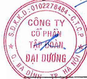
Mai Hữu Đạt Chủ tịch Hội đồng quản trị

Thông qua phát hành Báo cáo tài chính hợp nhất giữa niên độ